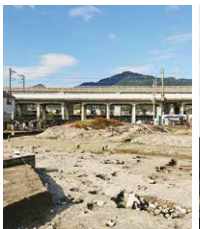
坂本城跡発掘調査 現地説明会