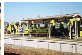
ひたちなか海浜鉄道（茨城県）