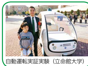
自動運転実証実験（立命館大学）

県では、企業や団体と協定を結び、認知症高齢者の見守り活動や、認知症サポーターの養成を進め、若年認知症の人ができる限りその能力を生かし働き続けられるよう企業への出前講座を実施している。また、認知症になっても孤立することなく地域で交流できるよう認知症カフェの取組や、 地域で安心して暮らせるよう地域住民による見守りの体制づくり を進めている。