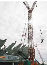
総合スポーツゾーン （栃木県）