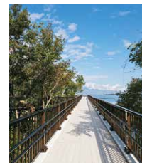
琵琶湖博物館 樹幹トレイルリニューアル