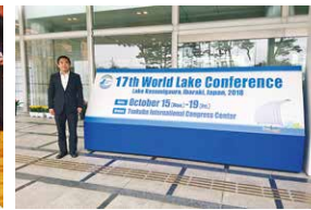
世界湖沼会議in霞ヶ浦（茨城県）