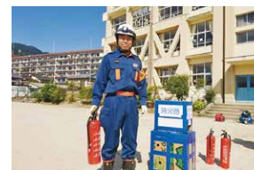
唐崎学区防災訓練

2020～23年度は共通テストの試験と民間の資格・検定試験の両方が用意され、2024年度からは国が認定した民間試験に一本化される予定である。民間試験では、 聞くこと、読むこと、話すこと、書くこと の力が測定をされ、4技能をバランスよく伸ばすことが必要であり、特に話すことや書くことを主とした活動をより多く取り入れた授業への改善を図っている。